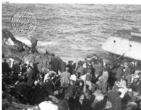
Παράνομοι μετανάστες από το Pentcho στο Καμηλονήσι παρακολουθούν καθώς το πλοίο βυθίζεται

Λίγες μέρες αργότερα, στις 9 Οκτωβρίου, ο λέβητας του πλοίου εξερράγη. Το πλοίο έσπασε στα δύο κοντά στο έρημο νησί Χαμιλονήσι που ανήκει στην επικράτεια των Δωδεκανήσων και ήταν υπό ιταλικό έλεγχο. Οι επιβάτες και το πλήρωμα μπόρεσαν να βγούνε στην ξηρά και να μεταφέρουν τις προμήθειές τους πριν βυθιστεί τελικά το πλοίο. Πέντε άνδρες πήραν το μοναδικό σωσίβιο σκάφος για να διασωθούν. Στη διαδρομή έπεσαν σε καταιγίδα και έχασαν τον προσανατολισμό τους. Τελικά διασώθηκαν από έναν Βρετανικό αντιτορπιλικό και μεταφέρθηκαν στην Αλεξάνδρεια.