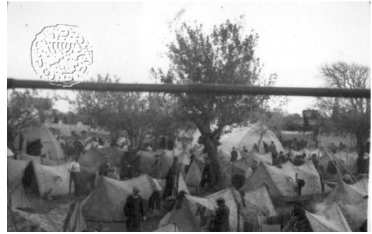
Στρατόπεδο San-Giovanni, σκηνές που στήθηκαν στο νησί της Ρόδου για τους παράνομους μετανάστες του Pentcho

Όταν το CRR έμαθε για τη βύθιση του Pencho, ενημέρωσαν τους Έλληνες στο Ηράκλειο, οι οποίοι στη συνέχεια προσπάθησαν να παραδώσουν προμήθειες στους προσαραγμένους πρόσφυγες στο Χαμηλονήσι. Στις 18 και 19 Οκτωβρίου, οι ιταλικές αρχές με δυο εξορμήσεις μετέφεραν τους πρόσφυγες στη Ρόδο. Οι πρόσφυγες έμειναν στη Ρόδο για ενάμιση περίπου χρόνο σε ένα πρόχειρα κατασκευασμένο στρατόπεδο στο γήπεδο ποδοσφαίρου της Ρόδου. Στις 25 Δεκεμβρίου τους μετέφεραν στο στρατόπεδο San Giovanni στη Ρόδο.